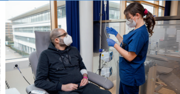
RBK UKOM / 05.2022

Eine Einrichtung des Bosch Health Campus der Robert Bosch Stiftung.